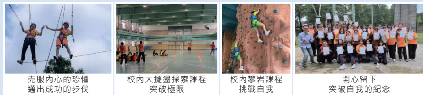
克服內心的恐懼邁出成功的步伐 | 校內大擺盪探索課程突破極限 | 校內攀岩課程挑戰自我 | 開心留下突破自我的紀念

本校自2007年開始發展探索教育為校本課程，更於2018年榮獲教育部「戶外教育成果」金牌獎。我們重視孩子的心靈成長，因此致力推動校內的「平面課程」、「大擺盪」、「攀岩」及校外「龍潭外展高空繩索活動」，期盼讓學生藉此學習與同儕互動和自我挑戰，以促進情境教學與生活連結，強化個人決策、問題解決與反思的能力與態度。