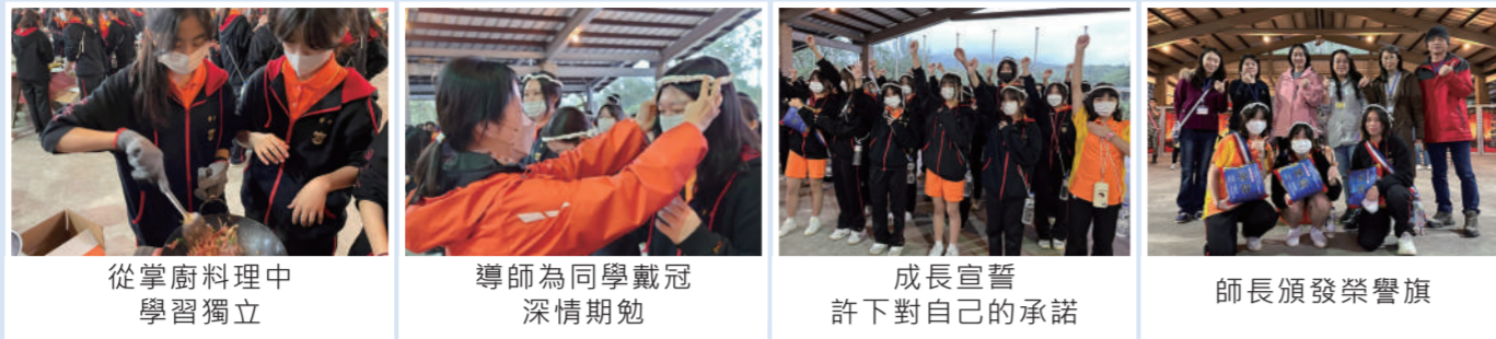
從掌廚料理中學習獨立 | 導師為同學戴冠深情期勉 | 成長宣誓許下對自己的承諾 | 師長頒發榮譽旗

高一成長營，透過野炊、漆彈、高空跳塔、探索教育活動，學生能展現秩序與紀律，並透過團隊合作增進班級凝聚力，甚至突破恐懼完成個人挑戰。最後的成年禮儀式上，許下對自己與班級的承諾，期許能為目標付出實踐，追求不斷的進步，以成就更好的自己。