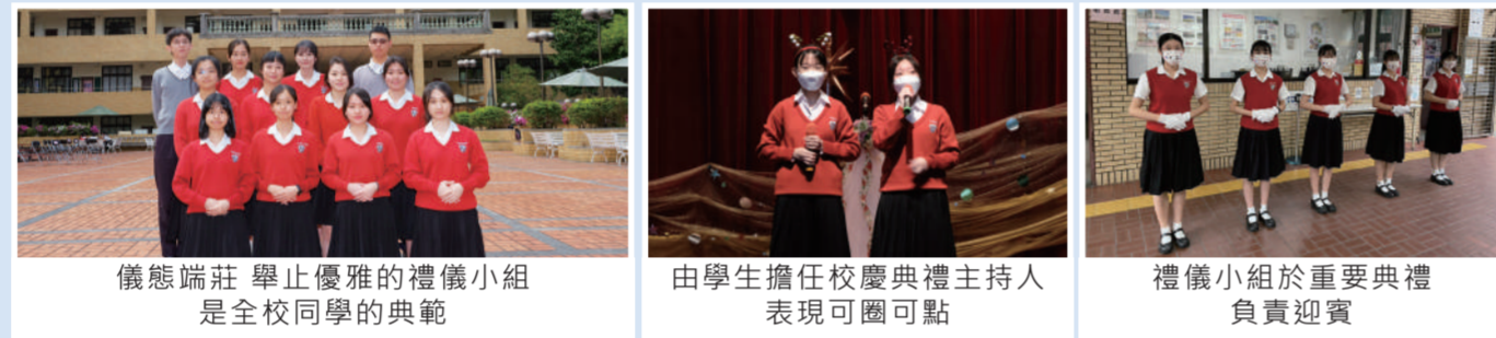
儀態端莊舉止優雅的禮儀小組是全校同學的典範 | 由學生擔任校慶典禮主持人表現可圈可點 | 禮儀小組於重要典禮負責迎賓

靜修每年遴選儀態優良、端莊大方的同學擔任禮儀小組，透過師長培訓及學長姐傳承，能在重要典禮中完美呈現靜修人的氣質。熱心服務的禮儀生們於各項典禮中擔任司儀或接待貴賓，彬彬有禮的儀態也能成為同學的楷模，幫助學校推展品格教育及生活教育。