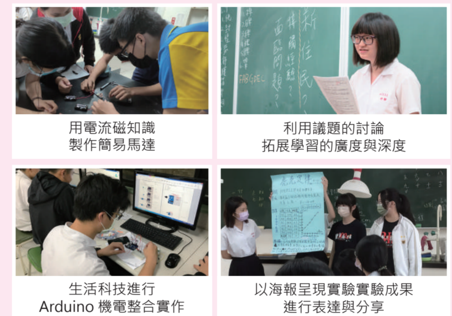
用電流磁知識製作簡易馬達 | 利用議題的討論拓展學習的廣度與深度 | 生活科技進行Arduino機電整合實作 | 以海報呈現實驗實驗成果進行表達與分享

108課綱強調核心素養的培育，為了讓學生具備適應現代生活和面對未來挑戰的特質，本校老師在教學的設計上總是不遺餘力。經常搭配參訪、桌遊、實驗、創作、發表、拍攝影片、社區參與等多元的教學活動，並結合生活中的議題，不僅拓展學生學習的廣度與深度，也透過「做中學」讓學生能將知識轉化為生活的能力及素養。此外，課堂以小組合作的方式，藉由討論與協作激盪出學習的火花，能增進問題解決及人際互動能力，以達適性揚才全人發展目標。