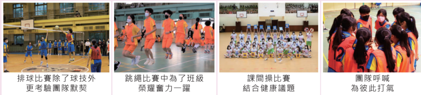
排球比賽除了球技外更考驗團隊默契 | 跳繩比賽中為了班級榮耀奮力一躍 | 課間操比賽結合健康議題 | 團隊呼喊為彼此打氣

體育競賽，除了能夠培養學生從事休閒活動的興趣，並促進學生的健康體能，更能在合作中增進學生彼此的情誼與班級的團隊氣氛。因此學校定期舉辦跳繩比賽、課間操比賽、排球比賽等團體競賽，讓學生在投入熱情參與的過程中，學會運動家的精神與團隊合作的素養。