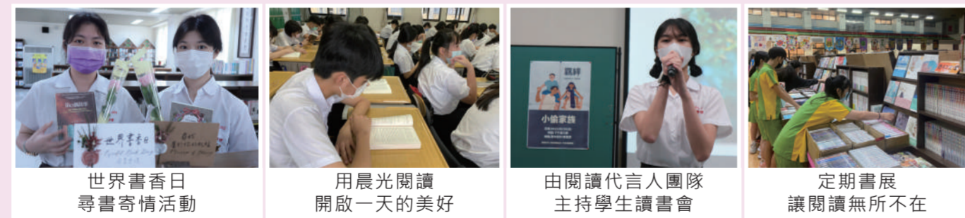
世界書香日尋書寄情活動 | 用晨光閱讀開啟一天的美好 | 由閱讀代言人團隊主持學生讀書會 | 定期書展讓閱讀無所不在

陶冶學生閱讀習慣，是奠定學生學習力的重要工作。靜修多年來推動圖書館利用教育、晨光閱讀、定期舉辦書展、行動書車、世界書香日等活動，並由學生擔任閱讀代言人，自發性舉辦讀書會，讓更多同學有機會接觸各類優良讀物，增廣見聞、培植閱讀素養。