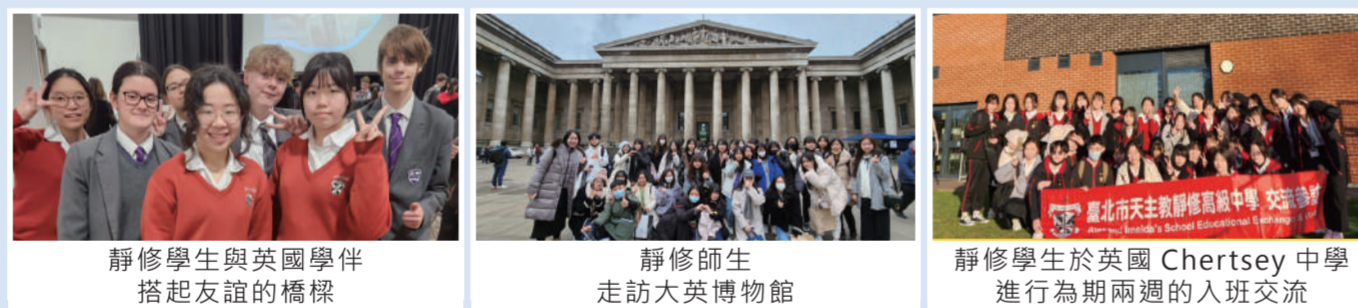
靜修學生與英國學伴搭起友誼的橋樑 | 靜修師生走訪大英博物館 | 靜修學生於英國Chertsey中學進行為期兩週的入班交流

學生們住在英國當地的接待家庭，除培養學生獨立性及處事能力以外，更深入了解當地的飲食、生活習慣及文化等，每天都能練習英文，體驗當地生活，學習英文更事半功倍。假日時，在藍牌城市導覽員的帶領之下，學生造訪了牛津大學、基督學院、溫莎城堡、倫敦眼、大英博物館、西敏寺及白金漢宮等知名景點，深度探索英國悠久的歷史文化和建築美學，真正實踐「讀萬卷書，行萬里路」之精神。