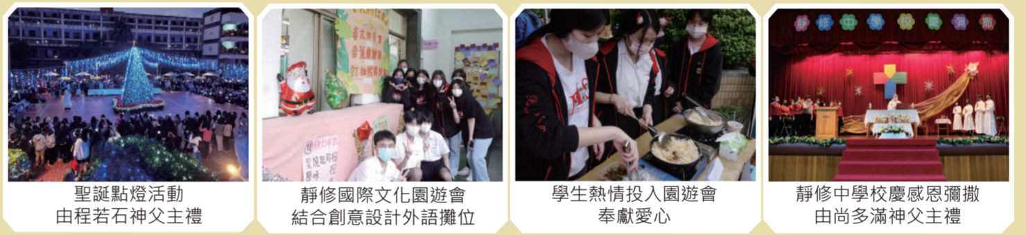
聖誕點燈活動由程若石神父主禮 | 靜修國際文化園遊會結合創意設計外語攤位 | 學生熱情投入園遊會奉獻愛心 | 靜修中學校慶感恩彌撒由尚多滿神父主禮

而校慶典禮主題為「流金·留今」。因每個學生都如「流金」般，正值可塑性高的年華，靜修的師長們期盼學生能找到自己的目標，在校園裡揮灑青春，努力形塑夢想的形狀，綻放璀璨光芒。此外，對於靜修而言，每分每秒都造就靜修的歷史，積累的歲月足跡也一步步推著靜修邁步往前，所以也願「留今」，留下每個今時此刻，創造永不退去的雋永燦爛。