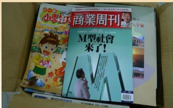
超過3年時效性雜誌