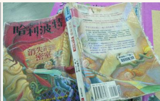
書況不佳、破損脫頁