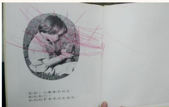
污漬塗鴉，影響閱讀