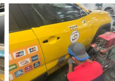
國都汽車 汽車板金業界實習