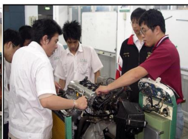
汽油引擎修護實習