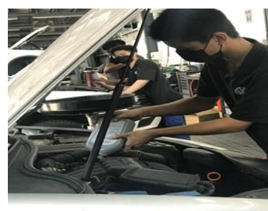
福斯汽車 業界實習