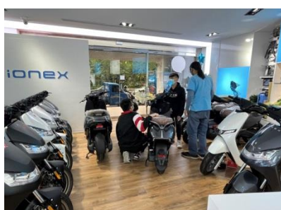
光捷電動機車 業界實習