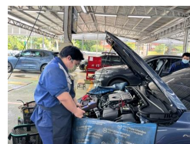
福特汽車 業界實習

學生進路：1. 進入職場工作 2. 選擇升學 3. 日間進入職場工作，夜間科大繼續進修