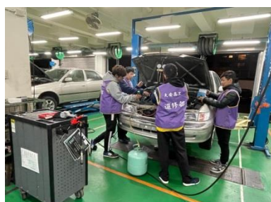
汽車電路(含空調)修護實習