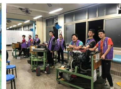
柴油引擎修護實習