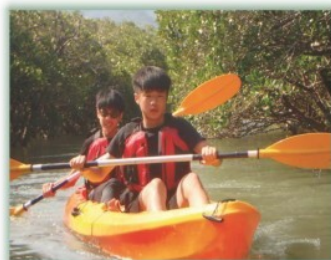
多元選修課程：體驗淡水河--- 進入紅樹林動植物生態體驗