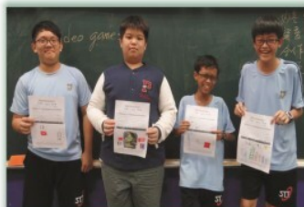
七八年級校定課程---英語會話 Self-introduction獨劇表演