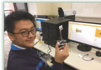
深廣選修課程---工程設計