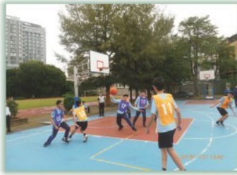
男孩子喜歡的球類運動---籃球