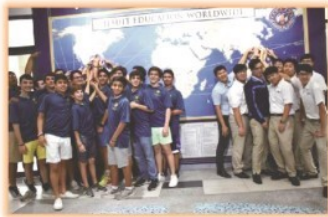
美國邁阿密Belen中學畢旅來訪