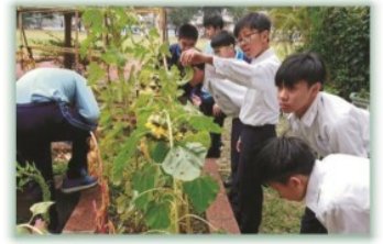
農務社---校園農作活化課程， 與生物、地理知識結合，實地 食物親手探究實作