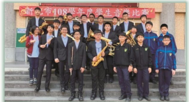
管樂社--- 107、108學年度新北市音樂比賽管樂合奏高中 職團體B組優等