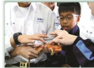
兩棲爬蟲社--- 由課堂活動、活體飼育、戶外 探索和交流研究全面的訓練， 讓孩子能具備對生物的敏銳洞 察力等優異特質