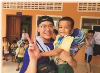
東單愛國際志工---到耶穌會柬埔寨學校進行教學工作，與孩子熱情互動