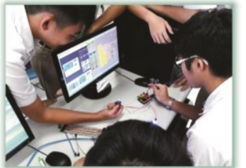
機器人社--- 汲取STEM教育的精神，加強實 作創新、跨領域能力的培養；整 合科學、工程、技術、數學，經 由資料收集、研究討論、實作等 步驟加強自主學習能力