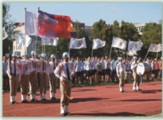
運動會---展現學生青春活力