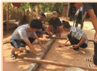
東單愛國際志工---志工們與柬埔寨當地農村村民一同修建房屋，勞動付出的同時分享愛