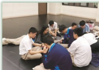
多元選修---徐匯樂思