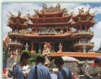
地理實察--- 大腳走三蘆，深入認識在地文化