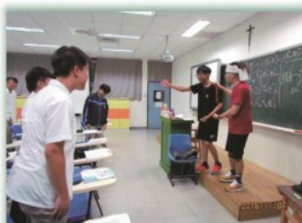
第二外語課程---日文課上課實況