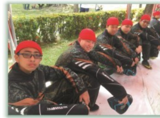
漆彈社--- 榮獲「2019校園暨親子神槍手全國漆彈大作戰」 國中組冠軍、高中組季軍