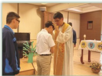
升學祈福禮--- 藉由祈福禮安定同學的心，並給予師長、同學的祝福。