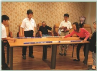
服務學習---長者陪伴