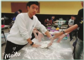
多元選修課程--- 做點心環遊世界