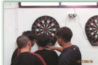
多元選修課程:飛鏢運動--- 介紹電子飛鏢靶