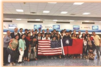
徐匯學生至美國邁阿密Belen中學體驗學習