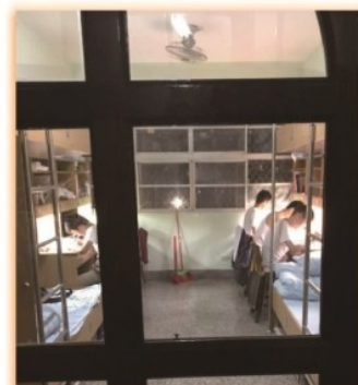
住宿生返宿後自修現況