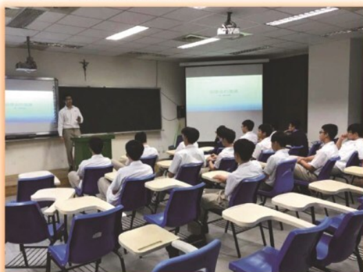
高中部住宿生繁星上榜學長給現有住宿生住宿經驗及考試準備分享座談