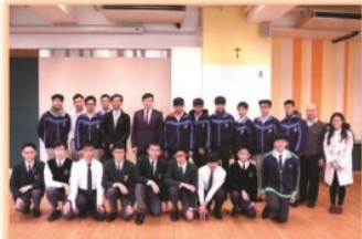
香港九龍華仁書院校長歡迎徐匯師生