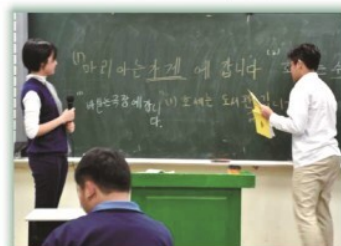
第二外語課程---韓文課上課實況