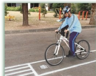
七年級校定課程---徐匯野學踏騎課程，校內設置培訓場地