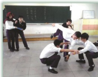
表演藝術課程---童話故事表演