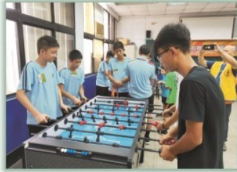
男孩子喜歡的活動--- 校內設有手足球教室，亦舉辦 2019北區校際盃團體挑戰賽