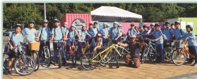
校外教學---寓教於樂的校外教學課程 八年級校外教學—環境教育(淡水踏騎)