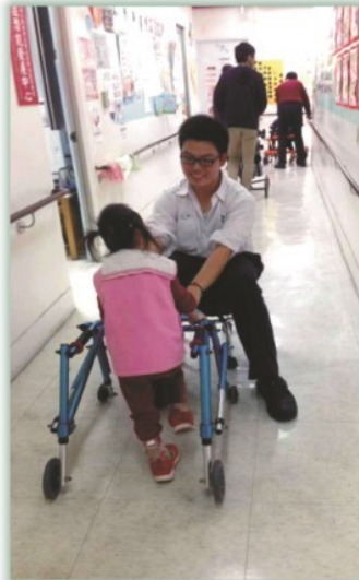
服務社--- 聖心兒童發展中心擔任志工