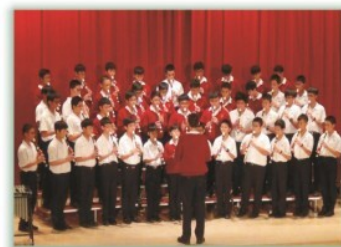
聖歌比賽--- 舉辦聖歌比賽，培養學生團隊合作的精神

善意溝通--- 善意溝通運用非暴力溝通的理念和技術，協助參與者覺察自己和他人的感受和需求，並以良好的表達方式進行溝通，建立與自己、與他人的和諧關係，更進一步提昇自我身心靈的成長。