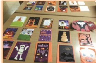
和美國聖路易高中交換卡片