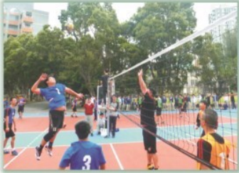
男孩子喜歡的球類運動---排球