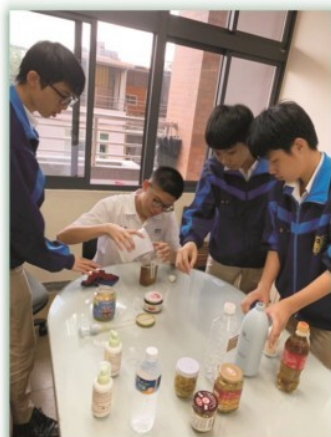
自然科實作課程--- 利用橘皮自製天然清潔劑