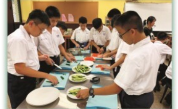
烘焙社---一個探索味蕾的歡樂 時光