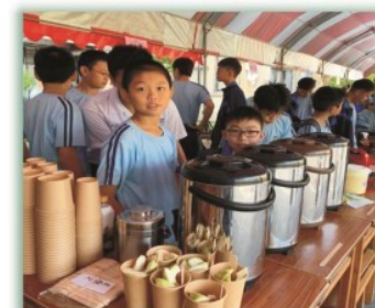
校慶暨仁愛濟貧園遊會--- 各班級設攤位義賣，所得捐獻社會公益團體及補助本校清貧學生，實現「從做中學」之教育方法，增進學生規劃執行活動之能力

開學祈福禮--- 舉辦高、國一開學祈福禮。 濯足禮--- 舉辦高、國二濯足禮。 升學祈福禮--- 舉辦高、國三升學祈福禮。 全校性各項活動--- 舉辦聖誕節、復活節系列活動。