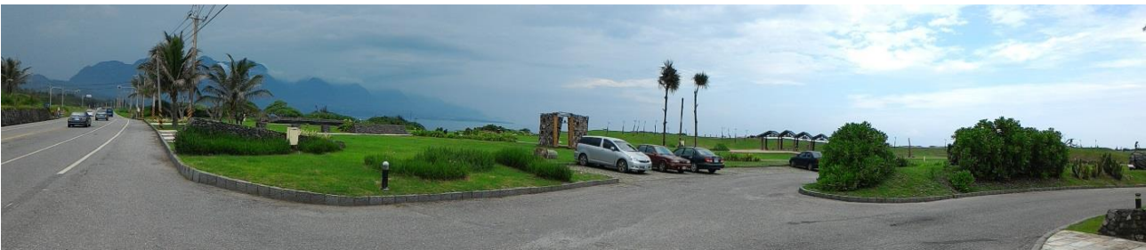
加路蘭遊憩區入口處