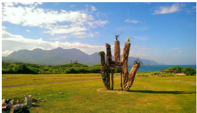
加路蘭遊憩區園區內部