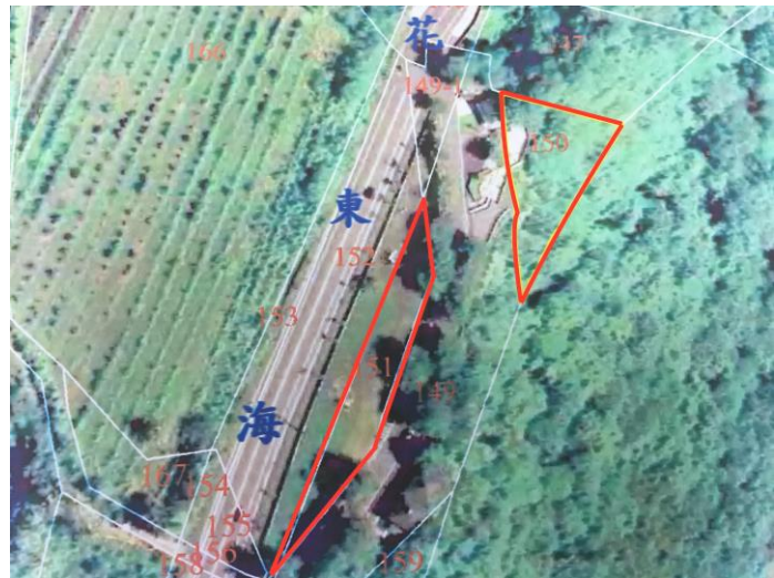
紅色區塊:可設置藝術作品之區域