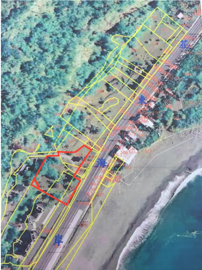
紅色區塊:可設置藝術作品之區域