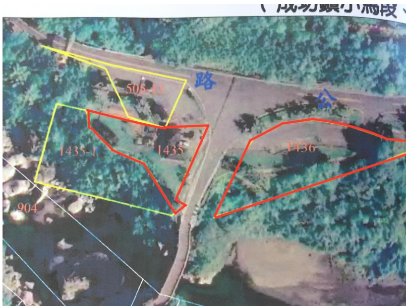
紅色區塊:可設置藝術作品之區域