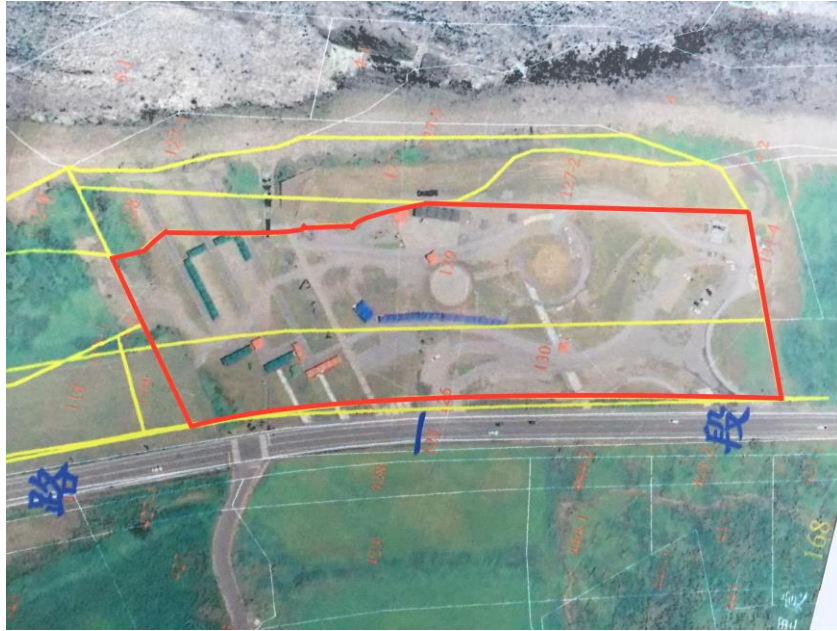
紅色區塊:可設置藝術作品之區域