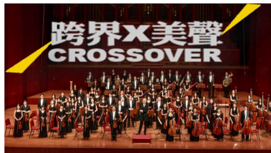
晨曦音樂會-跨界演出