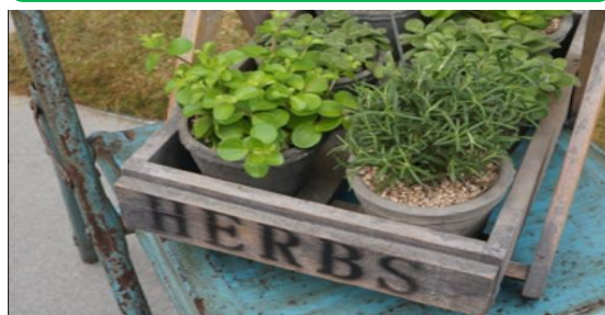
初點自然-好農市集