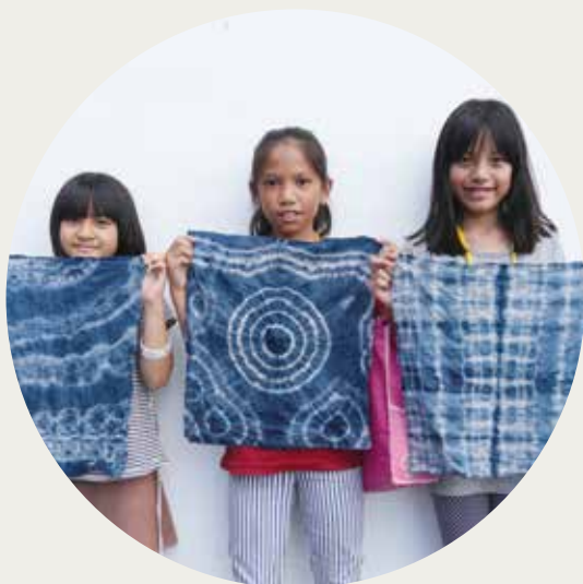
03 | 第三區隊 - 民權國小 藍染課程