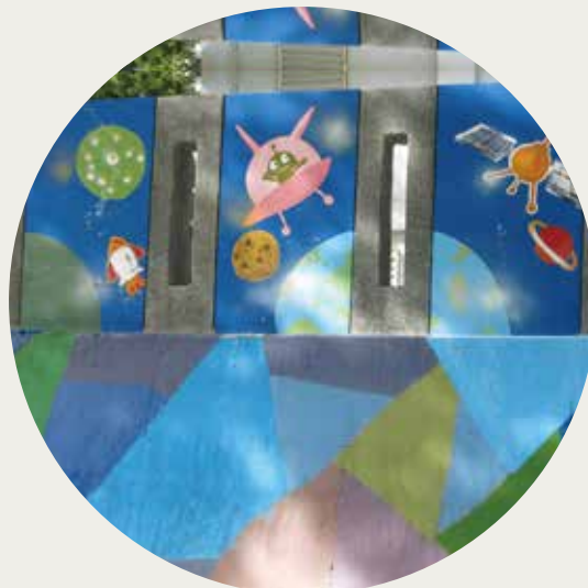
04 | 第四區隊 - 東里國小 牆面彩繪

良好、對偏鄉藝術教育有興趣及熱誠，肯吃苦耐勞且勇於接受挑戰之大專院校在學學生（含研究所以上）。