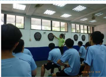
飛鏢>>> 除了要穩定高超的技術，算術能力 也不可或缺