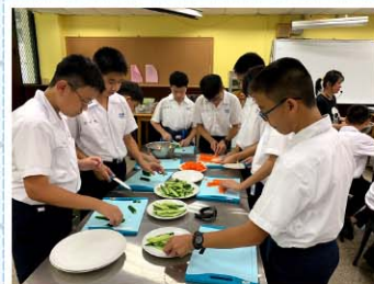
烘焙社>>> 一個探索味蕾的歡樂時光