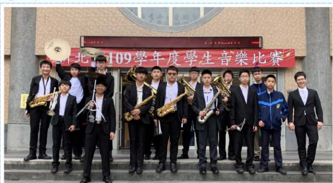
管樂社>>> 109學年度新北市音樂比賽高中職B組管樂合奏優等