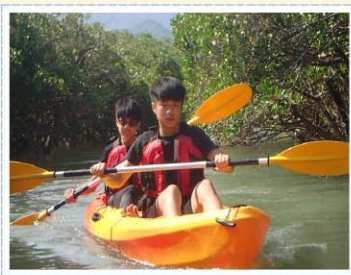
多元選修課程：體驗淡水河>>> 進入紅樹林動植物生態體驗