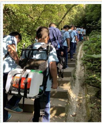
校訂課程>>> 野學措水，服務奉獻