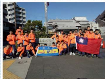
飛盤隊>>> 屢次代表國家至海外參加比賽