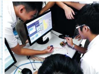
機器人社>>> 汲取STEM教育的精神，加強實作創新、 跨領域能力的培養；整合科學、工程、 技術、數學，經由資料收集、研究討論、 實作等步驟加強自主學習能力