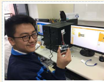
深廣選修課程>>> 工程設計