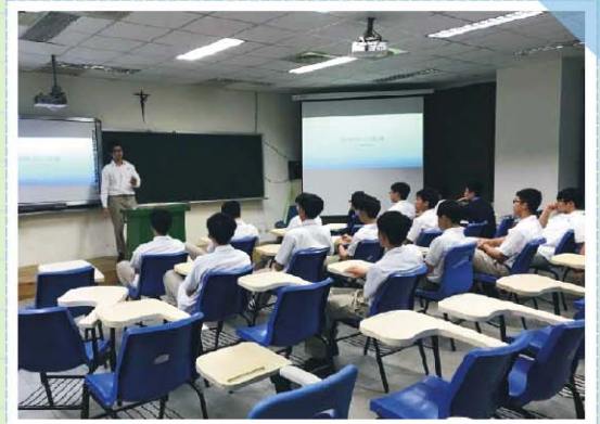
高中部住宿生繁星上榜學長給現有住宿生住宿經驗及考試準備分享座談