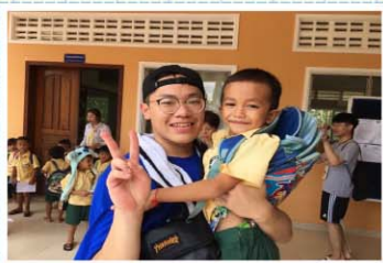
東單愛國際志工>>> 到耶穌會柬埔寨學校進行教學工作，與孩子熱情互動