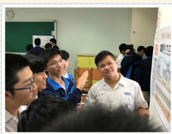
美術課程>>> 以視覺圖像介紹各國博物館