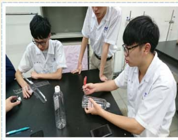
自然探究>>> 風力發電機實作