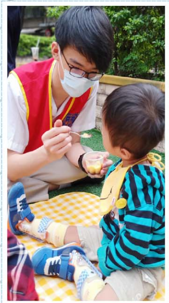
服務社>>> 聖心兒童發展中心擔任志工