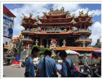
地理實察>>> 大腳走三蘆，深入認識在地文化