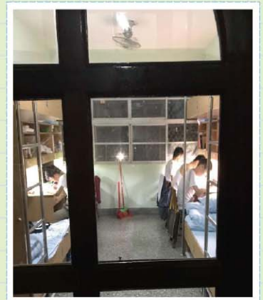
住宿生活>>>宿舍自修現況