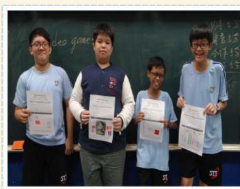
英語會話>>> Self-introduction 讀劇表演