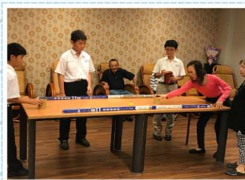
服務學習>>> 長者陪伴