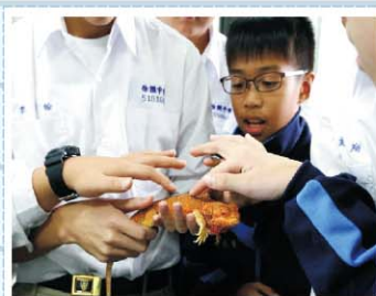
兩棲爬蟲社>>> 由課堂活動、活體飼育、戶外探索和 交流研究全面的訓練，讓孩子能具備 對生物的敏銳洞察力等優異特質