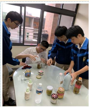
自然科實作課程>>> 利用橘皮自製天然清潔劑