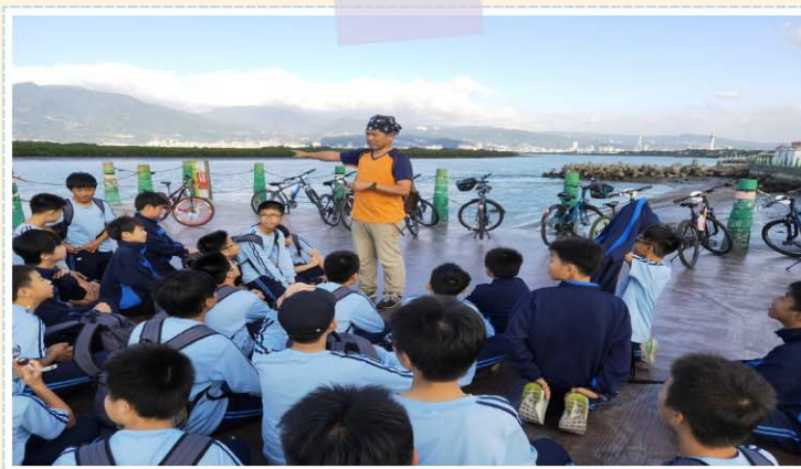
校訂課程>>> 野學環境教育(踏騎)