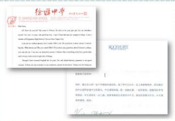
與美國Rockhurst高中學生書信交流