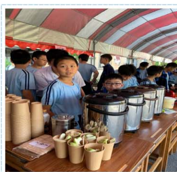
校慶暨仁愛濟貧園遊會>>> 各班級設攤位義賣，所得捐獻社會公益團體及本校清貧學生，實現「從做中學」之教育方法，增進學生規劃執行活動之能力。