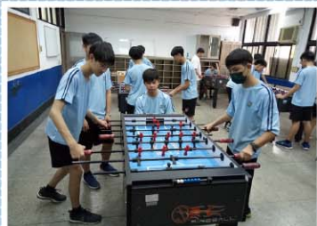
校內設有手足球教室， 是項新興運動