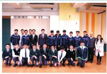
香港九龍華仁書院校長歡迎徐匯師生