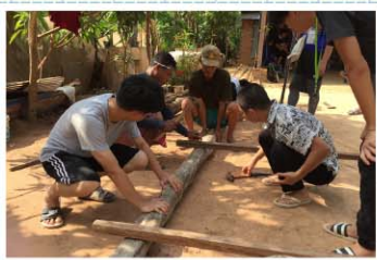
東單愛國際志工>>> 志工們與柬埔寨當地農村村民一同修建房屋，勞動付出的同時分享愛