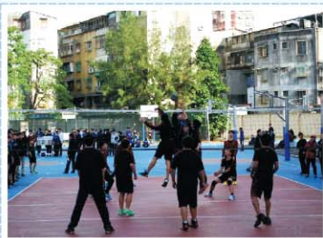
男孩喜歡的球類運動>>> 籃球、排球等