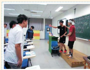
第二外語課程>>> 開設日語及韓語課程