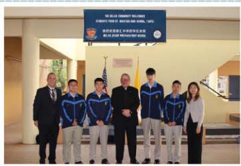
徐匯學生至美國邁阿密Belen中學體驗學習