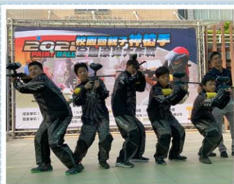
漆彈社>>> 2021校園暨親子神槍手全國漆彈大 作戰，國中組亞軍，高中組季軍