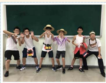
表演藝術課程>>> 服裝設計與走秀