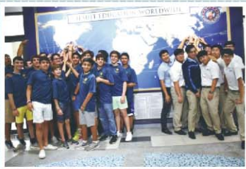
美國邁阿密Belen中學畢旅來訪