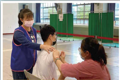
▲ 協助學生流感疫苗注射