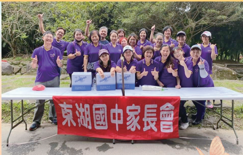
▲ 6.6 公里內溝溪越野賽開設加油補給站

東湖國中團隊持續合作，與孩子們相互學習，創造多元的教育環境、師資，共同打造「幸福學堂」。