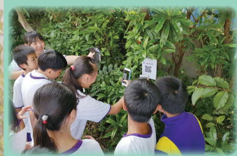
▲七年級內溝踏青趣