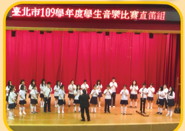
臺北市109學年度學生音樂比賽直笛組