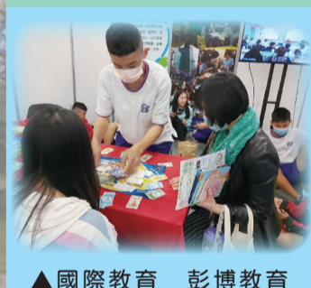
▲國際教育_彭博教育計畫_水世界桌遊