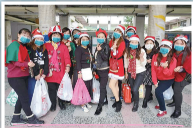
▲ 109 年歲末祝福活動