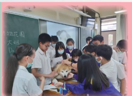
▲國際教育_國際筆友計畫-友善犬貓