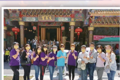
▲ 110 會考文昌宮親師祈福活動