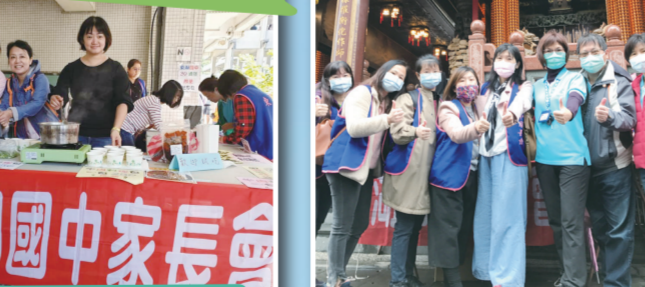
▲30週年校慶園遊會同樂