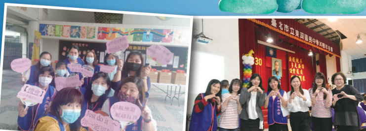
▲九年級包高中活動