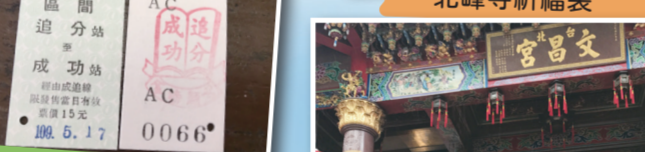
▲玉玲會長的心意-追分成功