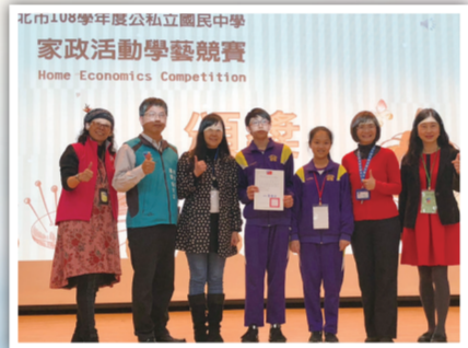
▲本校榮獲臺北市家政競賽團體獎第二名