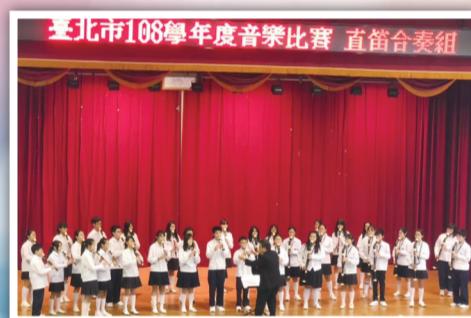
▲本校直笛團榮獲臺北市音樂比賽東區第一名