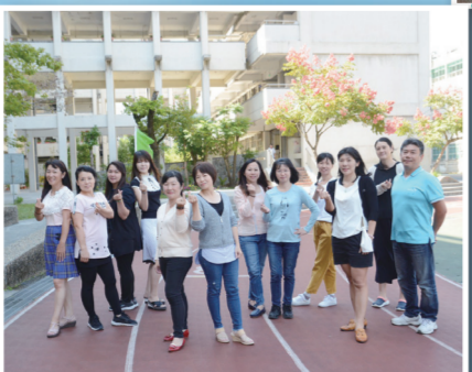
▲30週年校慶志工夥伴合照