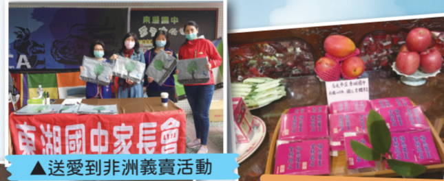
▲送愛到非洲義賣活動