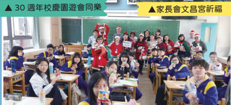
▲家長會聖誕節祝福發糖活動