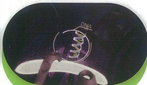
The Body VR(健康/醫學)