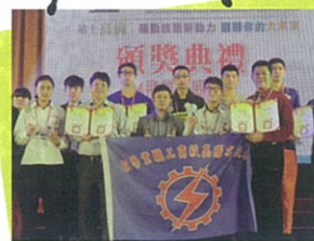
106學年全國技藝競賽獲全國第一、二名 5年內獲7座高職全國第一獎座