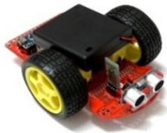
<小阿丟輪型機器人>