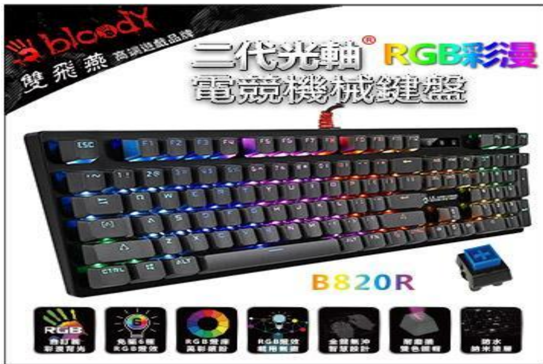
電競現場比賽鍵盤