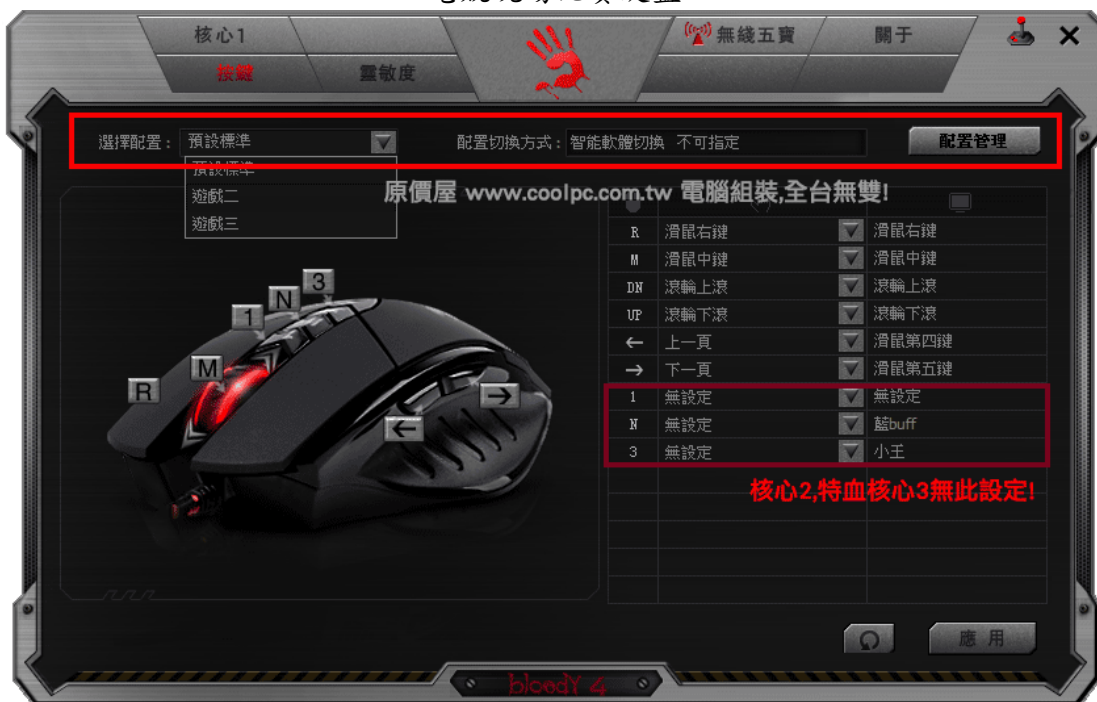
電競現場比賽滑鼠